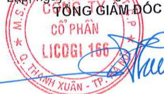
Vũ Công Hưng